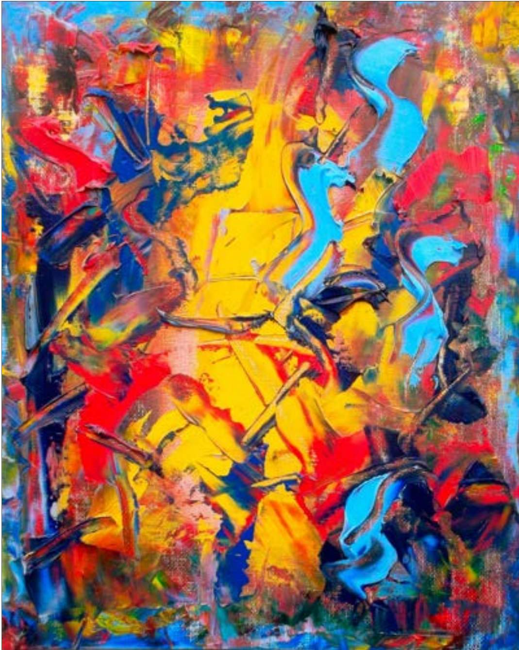
Abstract Composition X (2015), 27 x 22 cm, oil on canvas / huile sur toile