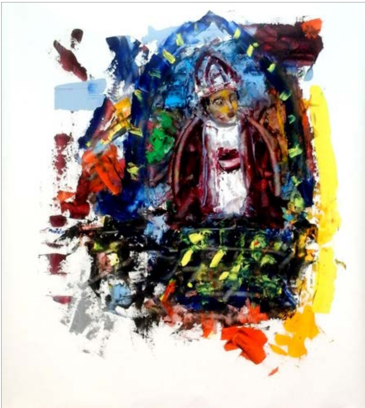
Le successeur de Saint Pierre (2014), 96 x 88 cm, oil on canvas / huile sur toile