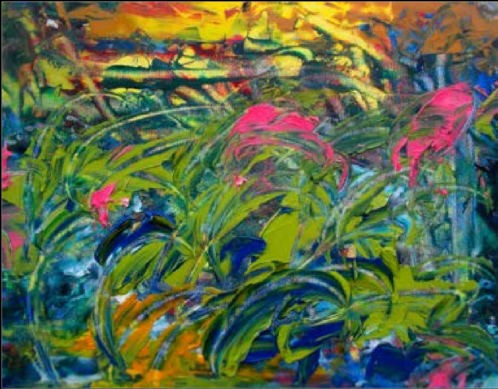
Abstract Composition III (2014), 18x24 cm, oil on canvas / huile sur toile Front / Première de couverture: Mariage en Périgord: Les mariés (2014), 96 x 99 cm, oil on canvas / huile sur toile

Fine Arts Toronto Gallery Historical & Contemporary Art