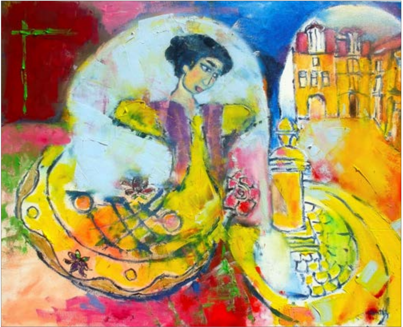
Un dimanche à Bergerac (2012), 50 x 70 cm, oil on canvas / huile sur toile