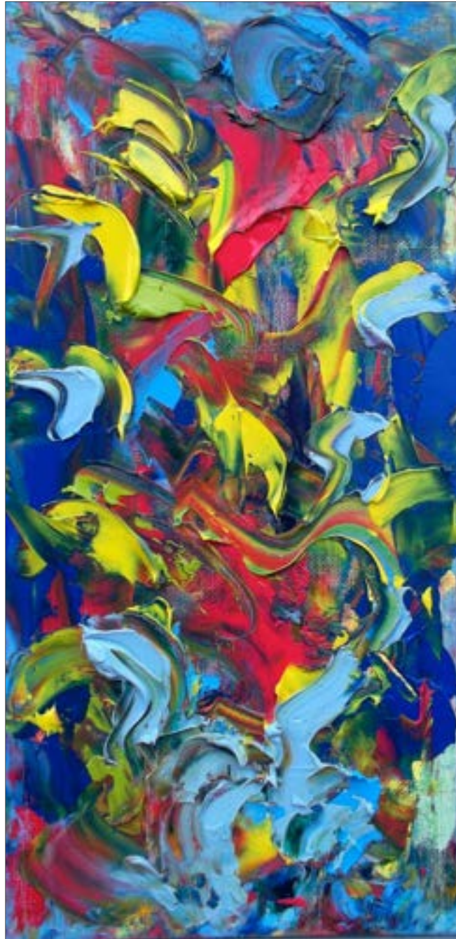
Abstract Composition IX (2015), 30 x 15 cm, oil on canvas / huile sur toile