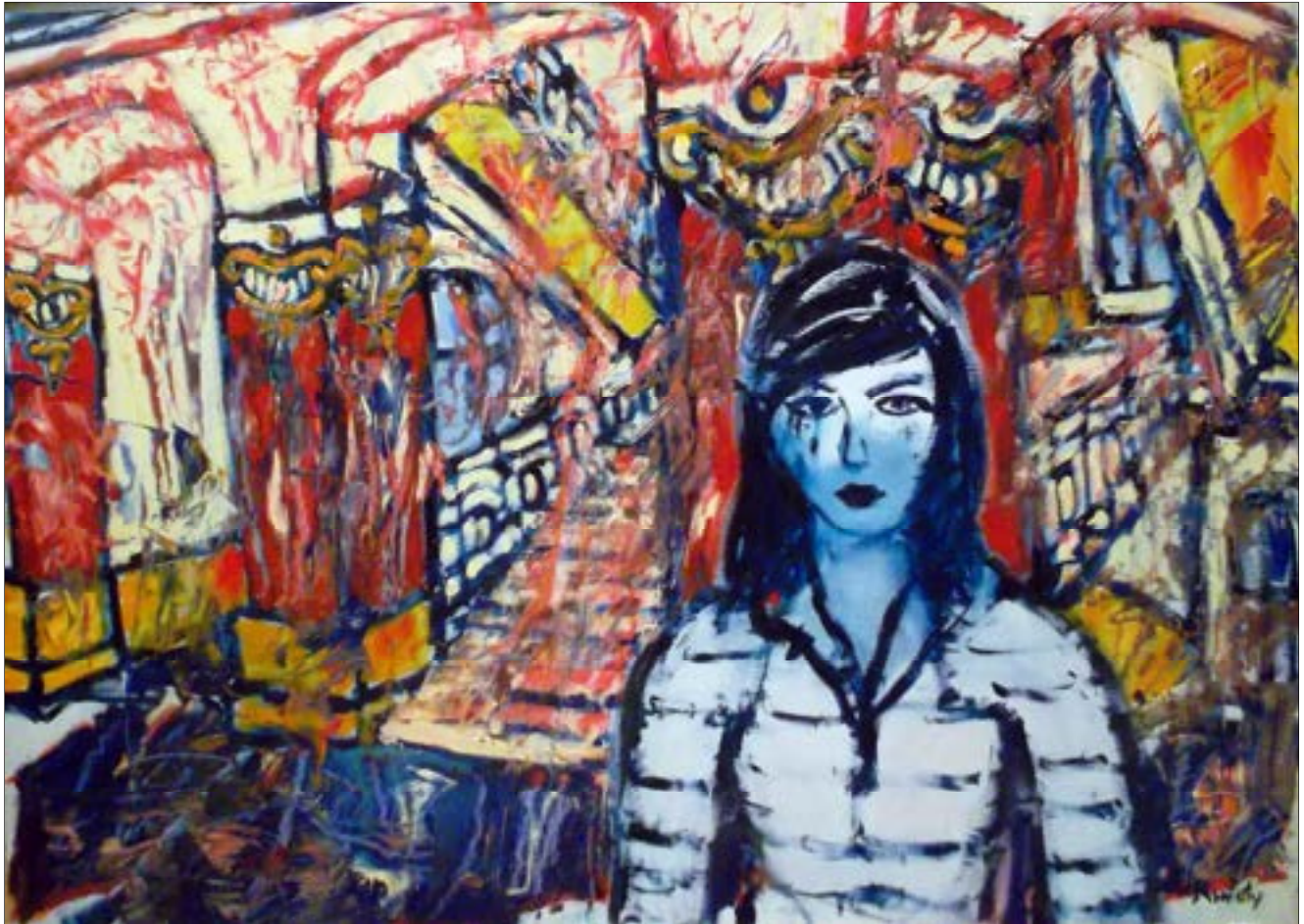
Autoportrait dans la tourmente de l'histoire (2011), 60 x 80 cm, oil on canvas / huile sur toile